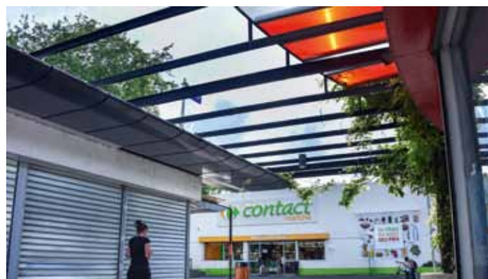
Le groupe Carrefour a décidé de fermer 90% de ses magasins de proximité (ex-Dia) dont les Contact Marché. 2100 salariés sont concernés.

FO n'a pas signé le livre 2 de la procédure qui justifie les licenciements. « L'une des raisons