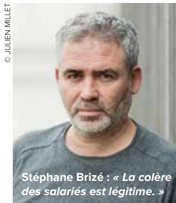
Stéphane Brizé : « La colère des salariés est légitime. »

Le réalisateur de « En guerre » a choisi Vincent Lindon pour endosser le rôle principal de son dernier film.